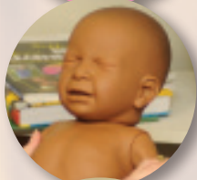
Demostrador Afectado por Drogas