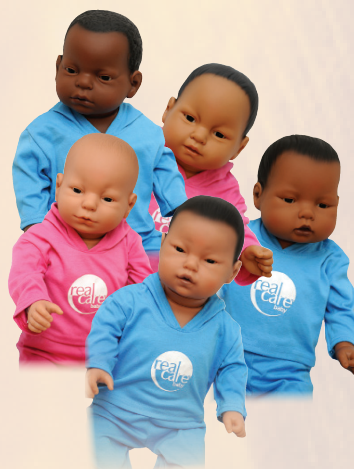
(3) Cinco Simuladores RealCare Baby II-plus