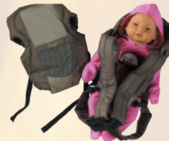
Snugli (cargador de bebés)