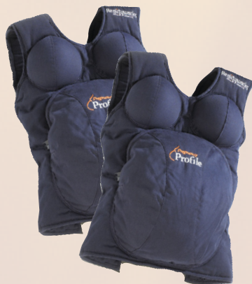
(1) Dos Chalecos de Perfil de Embarazo

¡Obtenga en un solo paquete un programa de paternidad y maternidad funcional, y listo para solo iniciar! Le ofrecerá a los participantes una mirada hacia el embarazo, (1) viendo las consecuencias del consumo de drogas y alcohol durante la gestación (2), cuidando a un recién nacido, (3) y preparando un plan para atender a un bebé que llora, previniendo así el Síndrome del Bebé Sacudido (4).