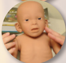
Maniquí del Síndrome de Alcohol Fetal