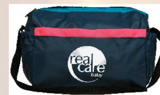
Bolsa de Pañales