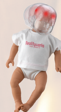
(4) Simulador de Síndrome del Bebé Sacudido

“ Lograr la implementación del Proyecto Bebé- Piénsalo Bien, en República Dominicana, ha sido una de las experiencias más enriquecedoras. A través del Proyecto llegamos a cada uno de nuestros adolescentes, de forma articulada entre gobierno, familia, escuela y sociedad; de esta manera nuestros adolescentes nos escuchan, nos estamos poniendo de acuerdo y hablando un mismo idioma. ”