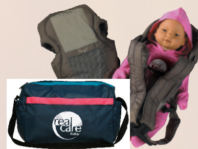
Bolsa de Pañales y Snugli®