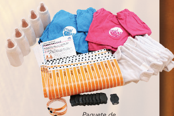
Paquete de Suministros Mediano