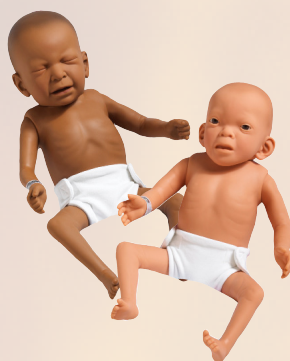
(2) Demostrador Afectado por Drogas y Maniquí del Síndrome de Alcohol Fetal